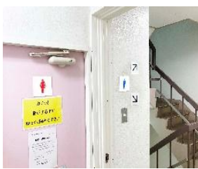
階毎に女子トイレ/男子トイレが分かれています♪