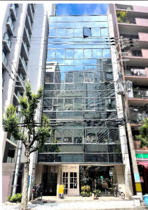
1F美容室の華やかなオフィスビル 隣の建物には100円ローソンが入っています♪