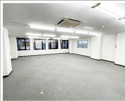
同タイプ別室例 ★30坪★