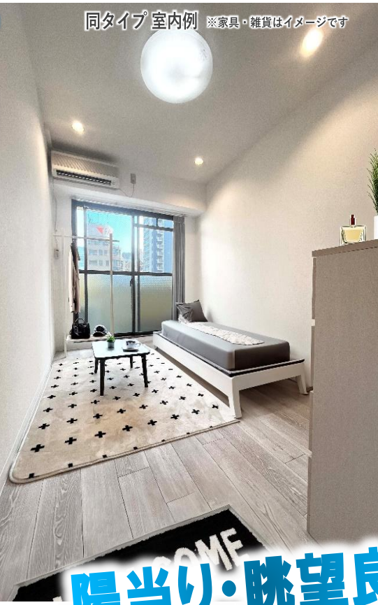
同タイプ室内例 ※家具・雑貨はイメージです