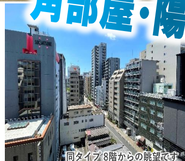
同タイプ8階からの眺望です