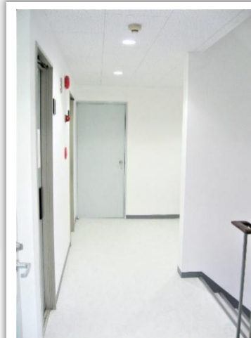
白を基調とした 明るく清潔感のある共用部