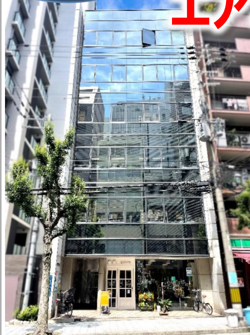
1F美容室の華やかなオフィスビル