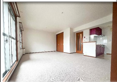
家族の笑顔が溢れる、温もり溢れる空間