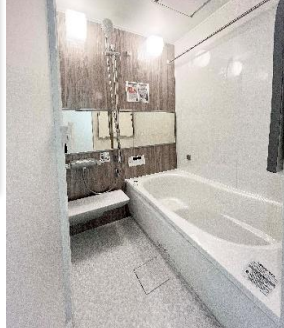
食洗器、浴室暖房乾燥機、追い焚き、センサー式照明の三面鏡付洗面台など最新の設備に新調しました！