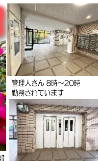
管理人さん 8時～20時勤務されています