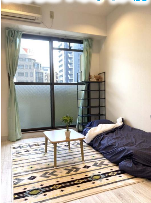
同タイプ室内例 ※カーテン・マットレス・ラグ・デスク等はイメージです

学生限定！ 初回保証料がお得！ 全保連 学生プラン 23,620円 → 10,000円 ※更新保証料1年ごとに10,000円です