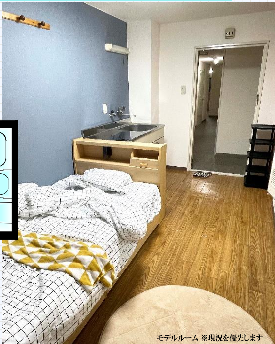
モデルルーム ※現況を優先します