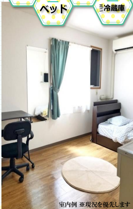
室内例 ※現況を優先します