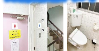
階数ごとに分かれており、4階は女子トイレです!