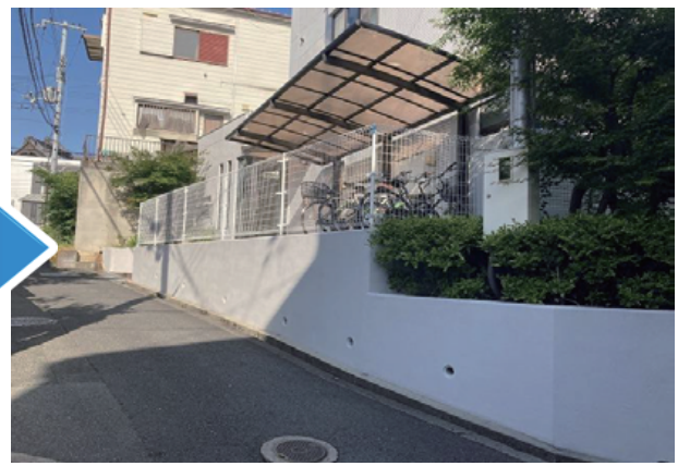
クラック部分にフィラーをすり込み、Uカットシート で補修した上で、高圧洗浄を行い塗装しました。