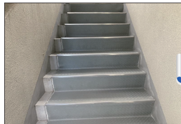
長尺シートが劣化して、剥がれが発生していました