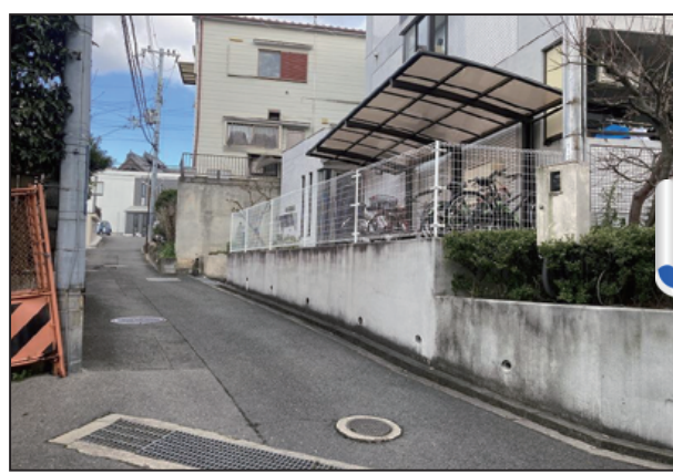
経年劣化により、クラックが発生していました 見た目も汚く、清潔感も感じられませんでした。