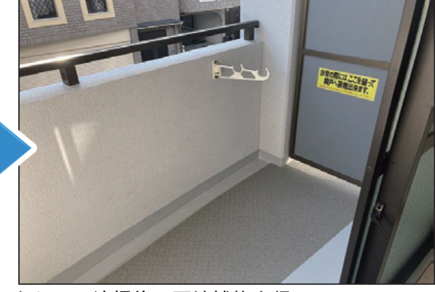
ケレン・清掃後、下地補修を行い、 長尺シートを張りました