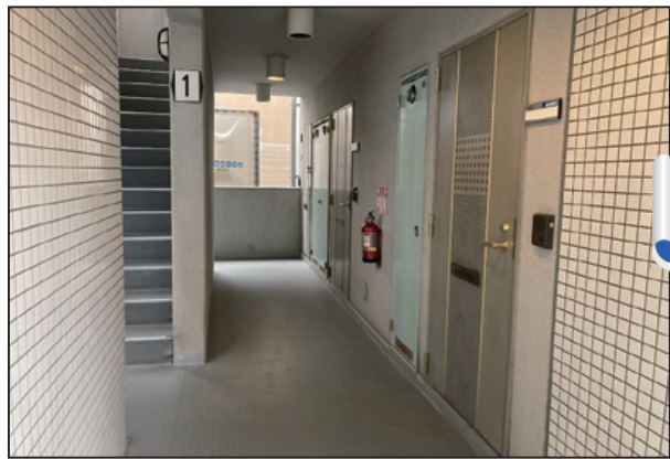
鉄部に錆が発生していました