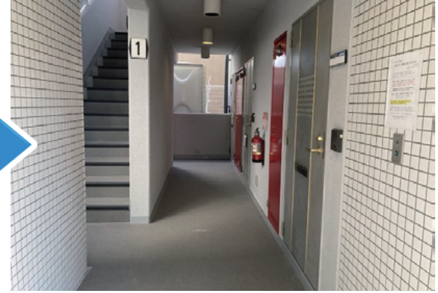
ケレン・清掃後、明るい色で塗装しました 一級建築士の先生にアドバイス頂き、選色しました。