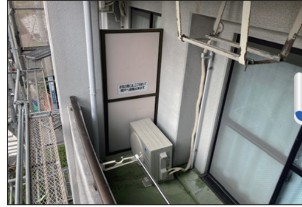
床の防水塗膜が剥離していました 壁・床の色に統一感がありませんでした